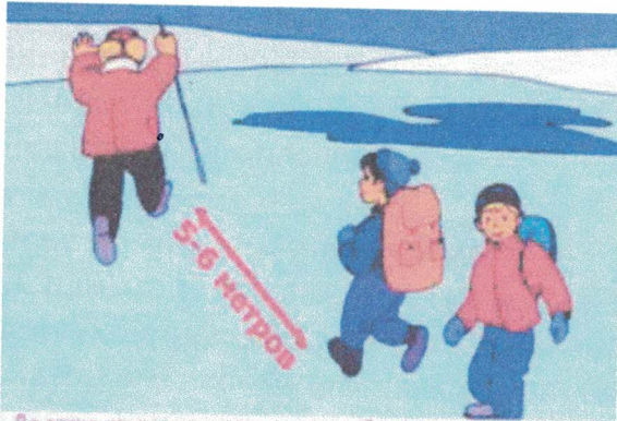
Во время движения группы по льду соблюдайте дистанцию 5-6 м.

- Если Вы передвигаетесь группой, то двигаться нужно друг за другом, сохраняя интервал не менее 5 - 6 метров, также необходимо быть готовым оказать помощь товарищу.